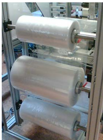
Aufnahme für 3 Folienrollen