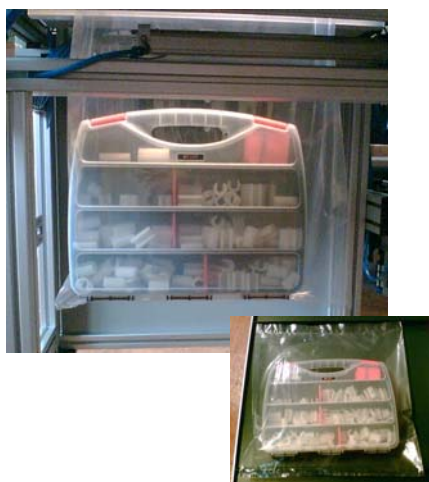
Werkzeugkoffer in der Füllstation und verpackt auf dem Förderband

Die Aufmachung der Verpackungsfolien ist sehr flexibel. Sie kann komplett transparent, transparent mit Weißstreifen (bei direkter Bedruckung), blickdicht weiß oder in anderer Farbe, aus reißfestem Tyvek oder aus einer sterilen Materialkombination sein. Optional kann die Integration einer Waage, einer automatischen Zuführstation oder eines Förderbandes zum Abtransport der verpackten Produkte realisiert werden.